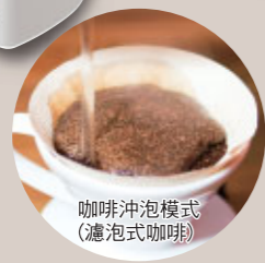
咖啡沖泡模式 (濾泡式咖啡)