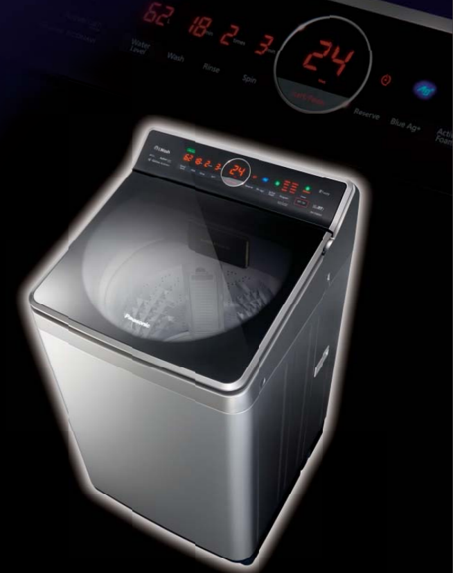
直驅變頻葉輪式洗衣機 NA-FA80X1